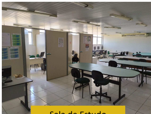
Sala de Estudo