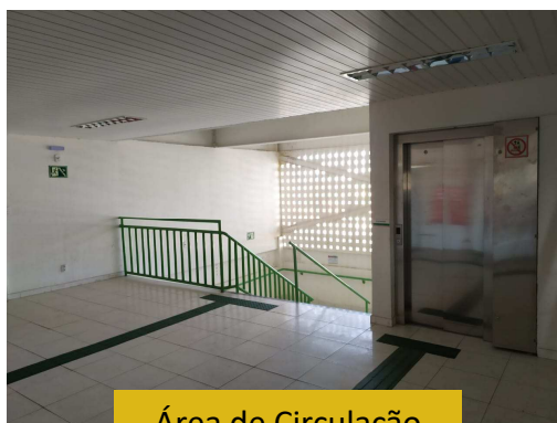
Área de Circulação