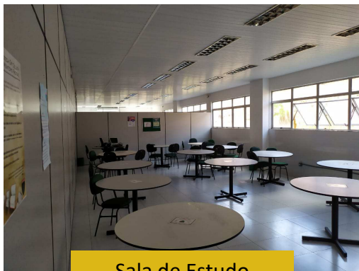
Sala de Estudo