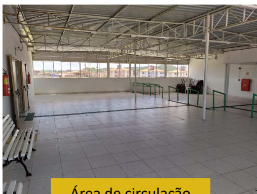
Área de circulação